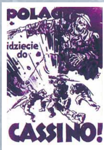
Niemiecka ulotka propagandowa rozrzucana w rejonie walk pod Monte Cassino