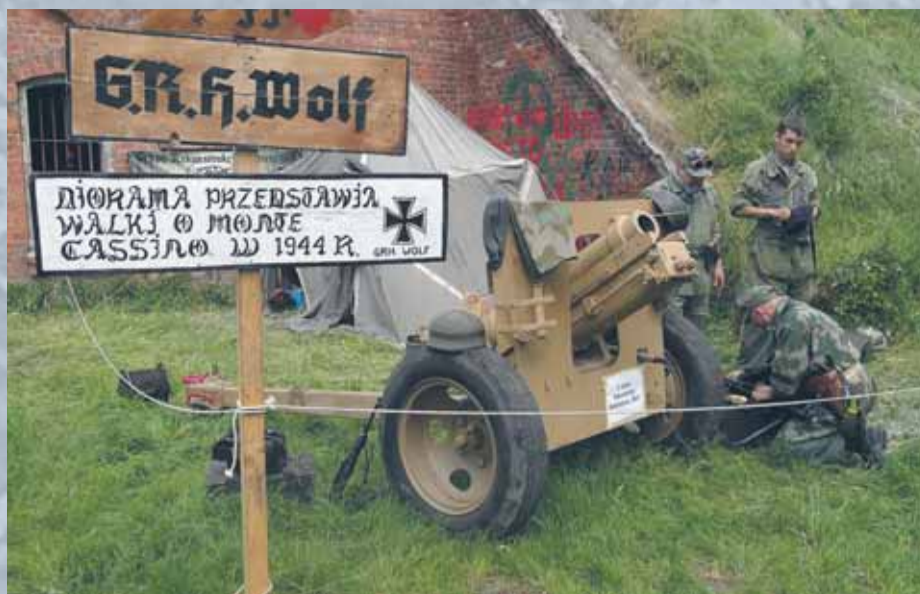
GRH „Wolf” prezentuje przygotowanie stanowiska artylerii niemieckiej 1 Dywizji Spadochronowej walki o Monte Cassino-diorama w Forcie Bema konwent gier „Grenadier” Warszawa maj 2014r.